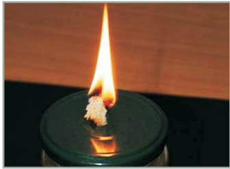
Aladins Wunderlampe Energieumwandlung vom Sonnenlicht bis zur Ölflamme