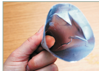
Ich fang die Sonne Sonnentrichter basteln und mit Lupen und Spiegeln experimentieren