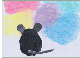
Frederick und die Farben Ölfarbe herstellen und Spektralfarben malen