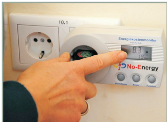
Ohne Strom nichts los? Energieverbräuche messen und ohne Strom auskommen