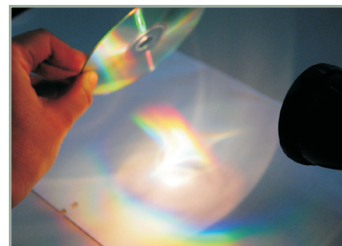
Mein Regenbogen Märchen und Experimente zu den Farben des Lichts