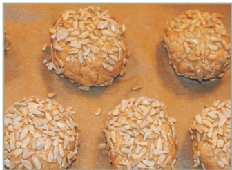
Kraftprotz-Brötchen Sonnenblumenkerne als Energielieferanten