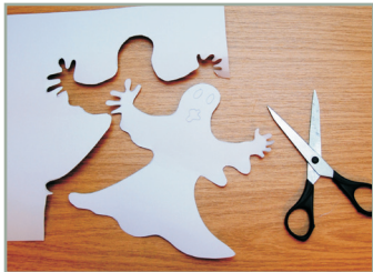
Lustige Schattenspiele Eigenschaften von Licht und Schatten erfahren