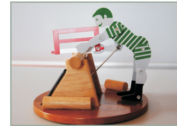
Sonnige Experimente Fotovoltaik mit Spiel und Spaß entdecken